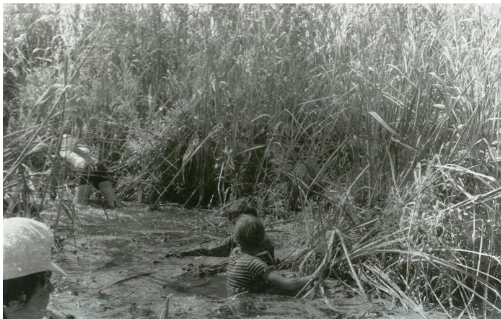
Hledání špuntu na jezeře Bizam

Druhá rovina jsou lidi. Kromě našich kluků to byli Lipovani, kteří na nás byli milí. Dokonce mne jedna babka na trhu upozornila: „Haló, mladý pane, zavřte si tu brašnu, to víte, jste v Rumunsku a tady se krade.“ Nevím, jak moc se tam kradlo, jinou zkušenost jsme tam nezískali. A potom ti kluci - od největšího (mého zástupce Racka), po nejmenšího Štíška. Když už se tu a tam náhodou někomu něco stalo, ostatní se o něj postarali, velcí pomáhali malým, malí velkým plně důvěřovali.