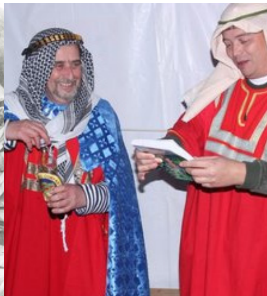
Vezír během Expedice Delta a Vezír o 25 let později při křtu knihy.